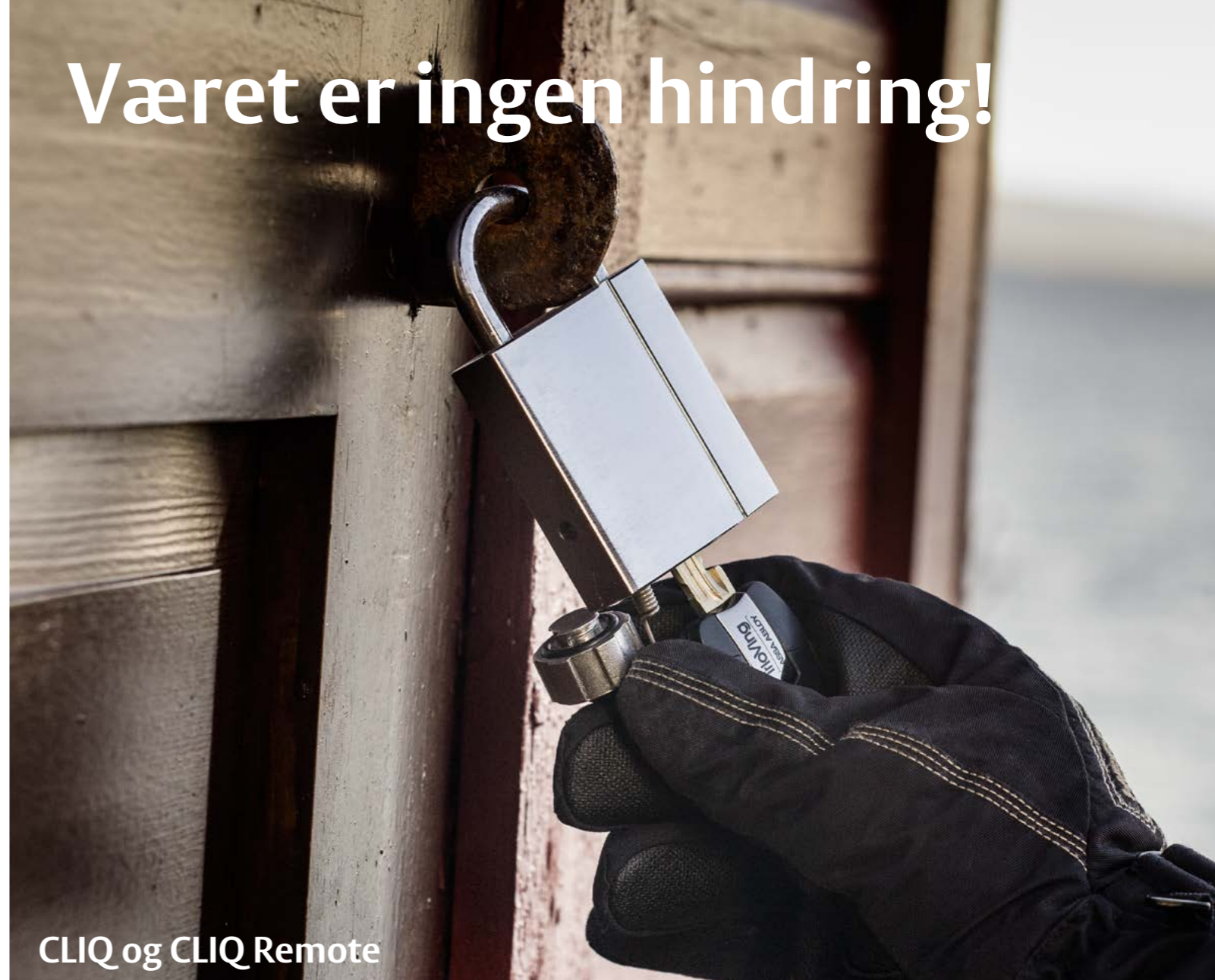
CLIQ og CLIQ Remote

TrioVing hengelås WP er perfekt for bruk sammen med TrioVings elektromekaniske system, CLIQ eller CLIQ Remote. Med CLIQ kombinerer du den kjente mekaniske TrioVing-sikkerheten med en elektromekanisk, kryptert kode. CLIQ er unikt og kan brukes overalt, også i hengelåser som står utsatt til. Det er også mulig å få TrioVing hengelås WP til andre systemtyper enn CLIQ. Det er ikke noen begrensning og låsen kan leveres til alle TrioVings sylindereplattformer som dp, System 10, d12, standard systemsylinder og standardsylinder.